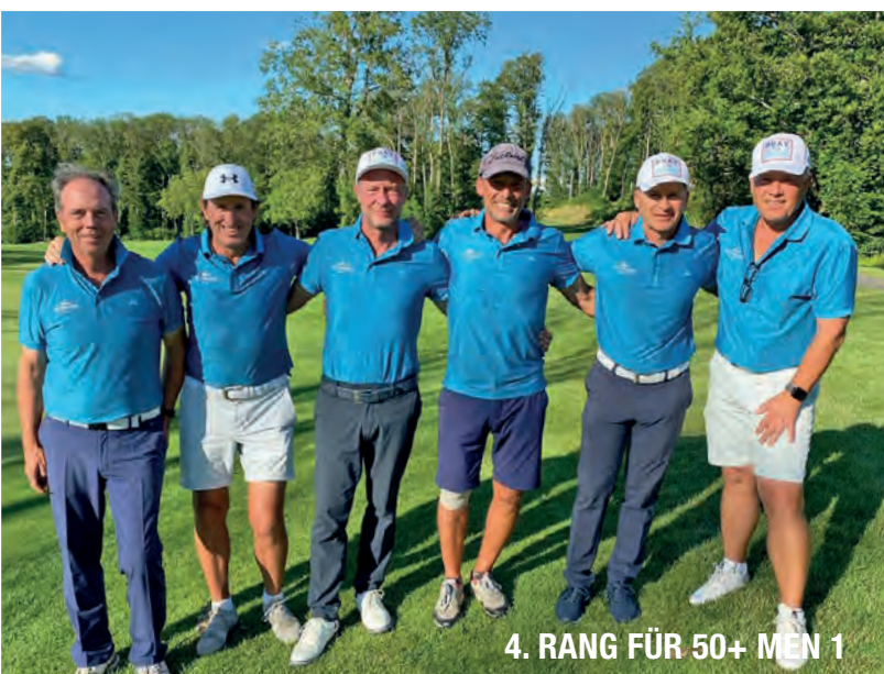
4. RANG FÜR 50+ MEN 1