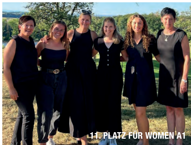
11. PLATZ FÜR WOMEN A1