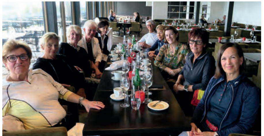
Nach dem Frühlingserwachen Turnier genossen die Sempacher Ladies das gemütliche Beisammensein.