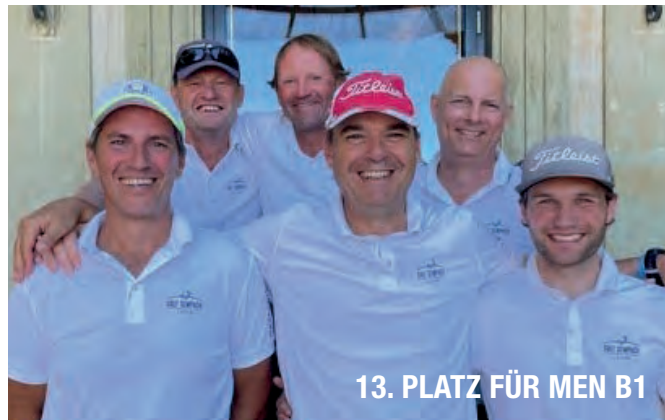
13. PLATZ FÜR MEN B1