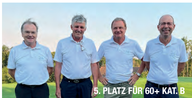
5. PLATZ FÜR 60+ KAT. B