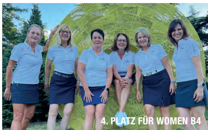
4. PLATZ FÜR WOMEN B4