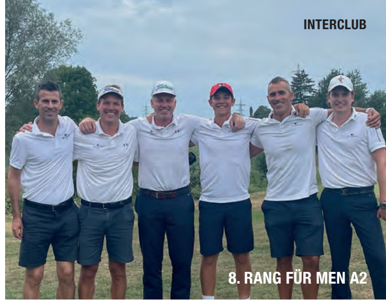
8. RANG FÜR MEN A2