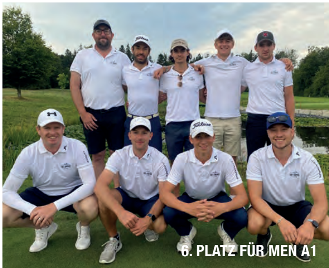
6. PLATZ FÜR MEN A1