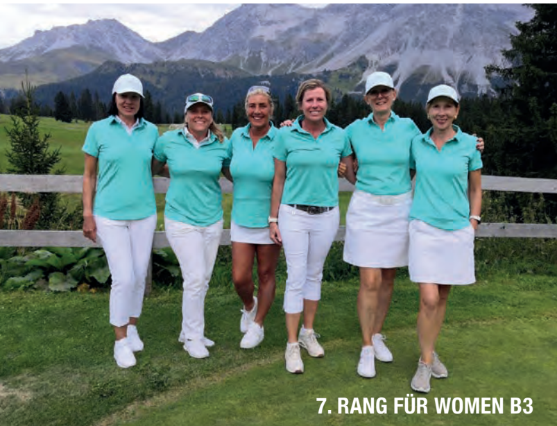
7. RANG FÜR WOMEN B3