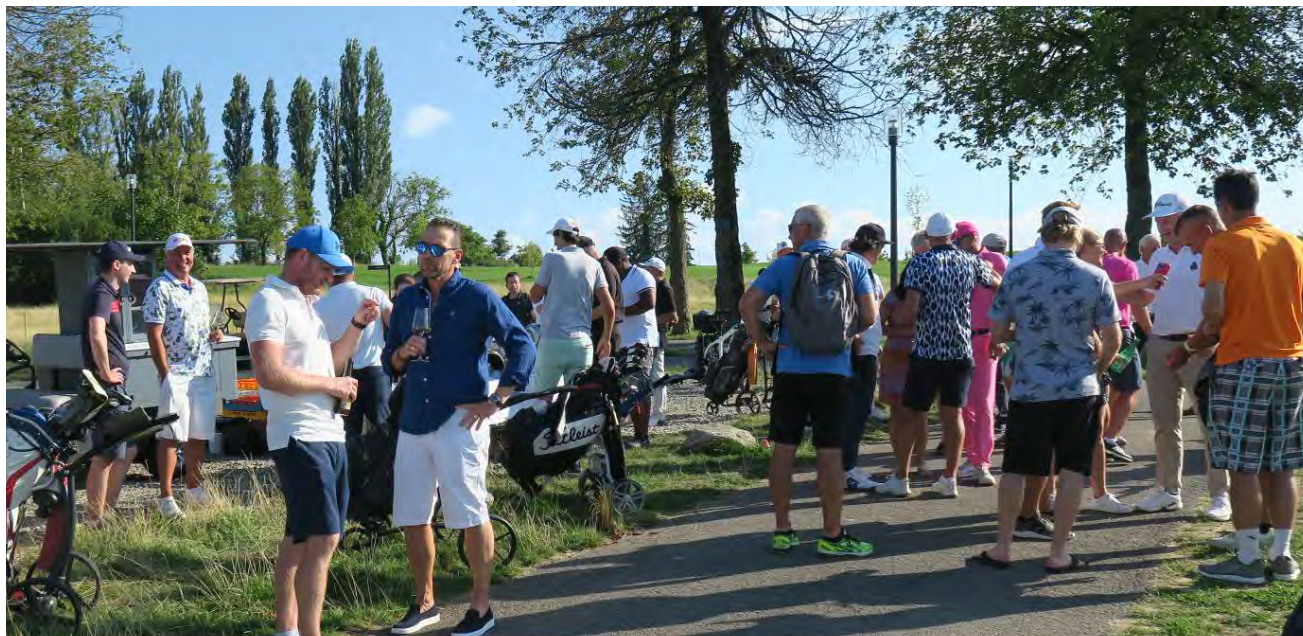
Zahlreiche Zuschauer und Golfspieler geniessen bei Loch 18 eine Wurst vom Grill und schauen den Flights zu.