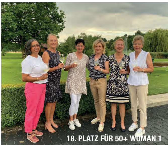
18. PLATZ FÜR 50+ WOMAN 1