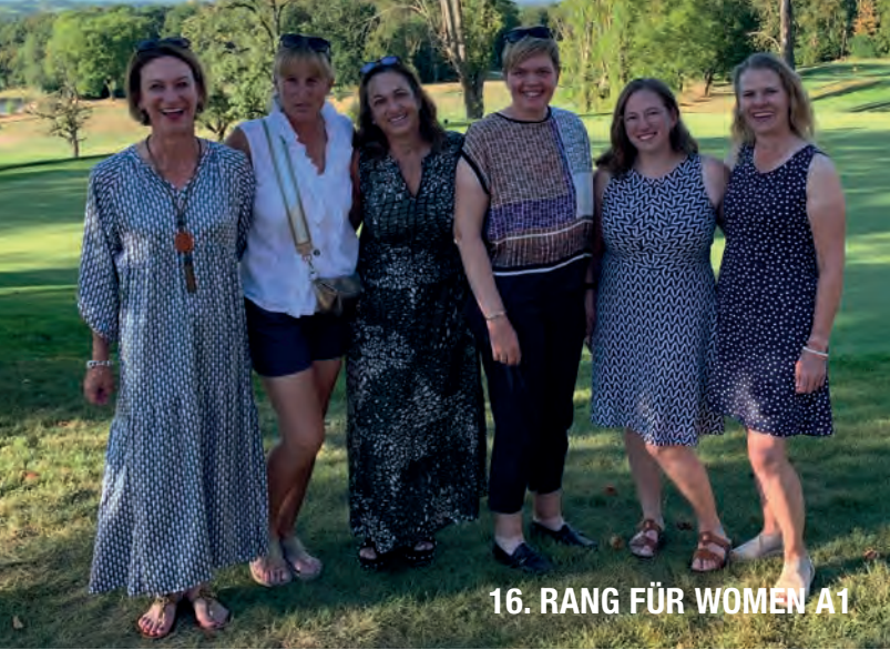
16. RANG FÜR WOMEN A1