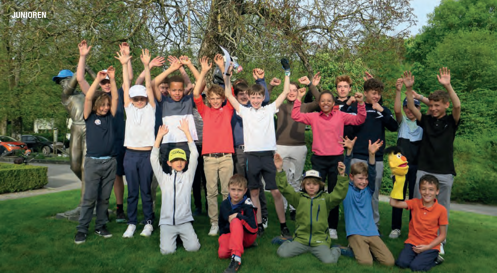
Die Junioren leben auf Golf Kyburg ihre Energie und Begeisterung fürs Golfspielen aus.