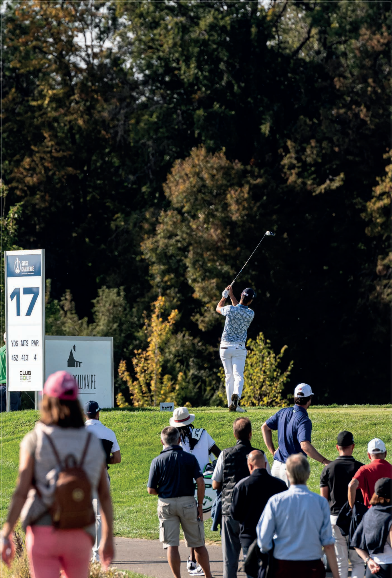
Zahlreiche ZuschauerInnen und Zuschauer auf dem Früh Garden 18 Hole Course. Der Platz wird dieses Jahr noch anspruchsvoller, indem die Platzlänge wie auch die Pin Positions weiter ausgeschöpft werden.