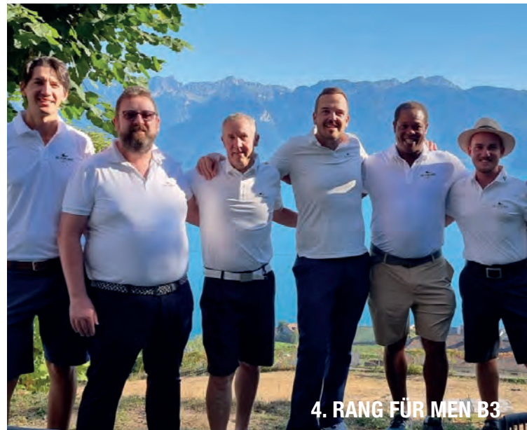
4. RANG FÜR MEN B3