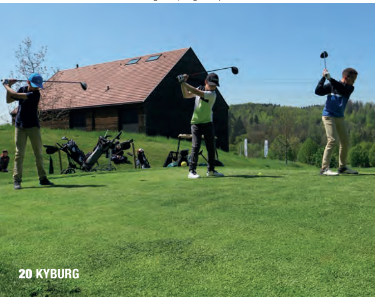
Die Junioren übten fleissig im Spring Camp 2022.

aussergewöhnlichen Einsatz. Das Mittagessen wurde im Clubhaus eingenommen – auch hier wurden die Camp Teilnehmer auf höchstem Level verwöhnt.