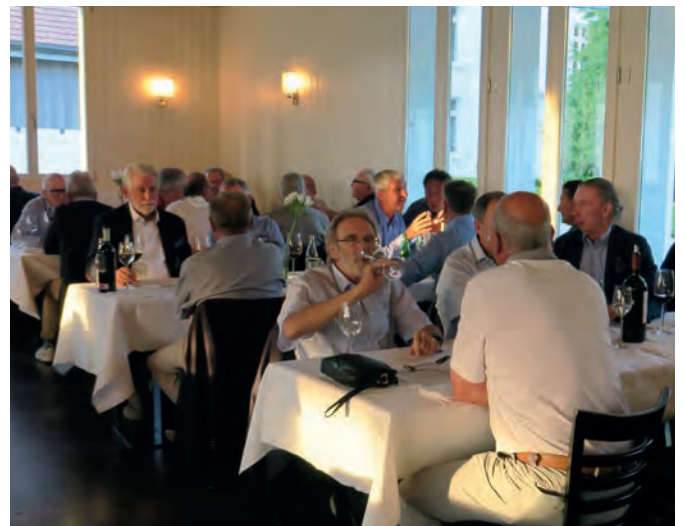
Die Senioren lassen das Best Agers Turnier im Juni 2022 kulinarisch ausklingen.