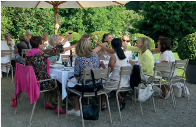
Nach der Ladies Spring Trophy vom Mai 2022 stiessen die Teilnehmerinnen gemeinsam auf ein erfolgreiches Turnier an.

Im April 2022 starteten die Ladies des Golf Clubs Kyburg in eine intensive Golfsaison. Bis August fanden zwölf Turniere statt – zwei davon zusammen mit unseren Senioren. Besonders beliebt waren Spielformen mit selbst gewählten Teams.