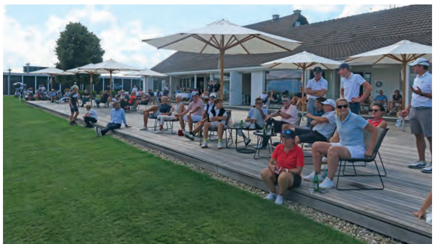
Die Zuschauerinnen und Zuschauer beobachten die präzisen Schläge der Flights vor spektakulärer Kulisse.