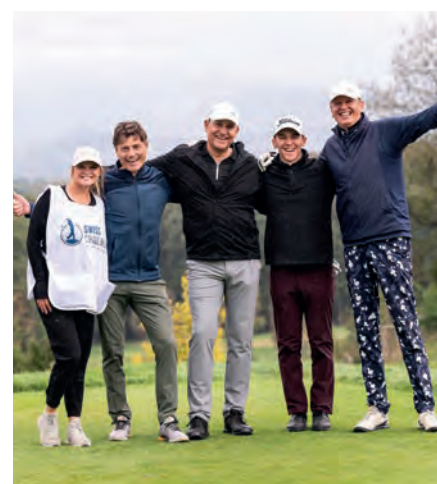
Die Teilnehmerinnen und Teilnehmer des Pro-Am Events hatten sichtlich Spass – trotz Regen.