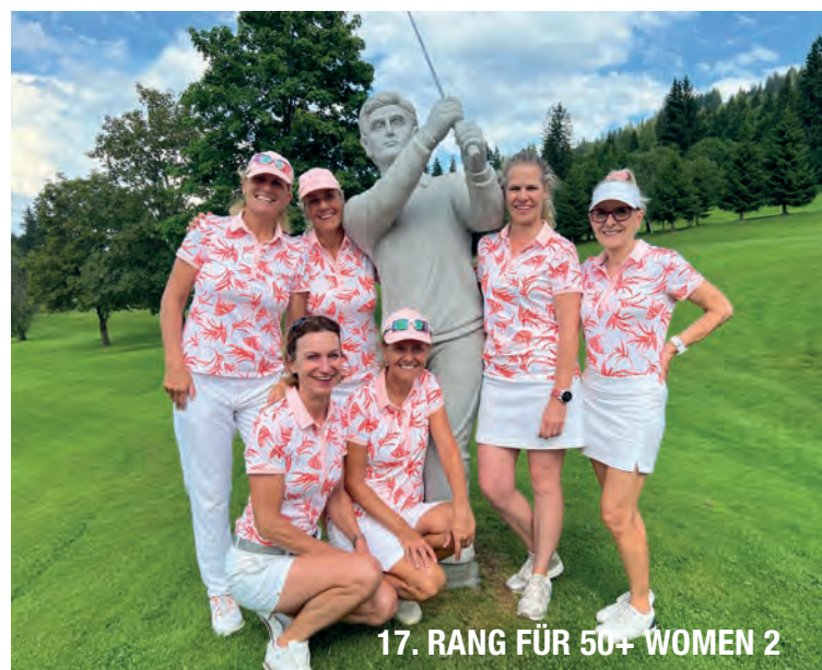
17. RANG FÜR 50+ WOMEN 2